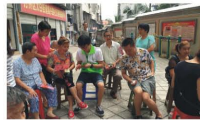
(图文：万州明爱社会工作服务中心复兴路社区社工室)

此次活动很好的普及了慈善知识，传播慈善文化，推动慈善法家喻户晓、深入人心。通过学习宣传贯彻慈善法，有利于弘扬传统美德，传播慈善文化，培育和践行社会主义核心价值观。