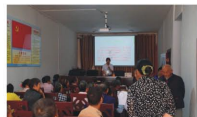
(图文：万州明爱社会工作服务中心洪安村社工站)

此次宣传活动让广大村民认识了慈善法，进一步加深了对社工的了解。有利于弘扬传统美德，传播慈善文化，培育和践行社会主义核心价值观。村民还总结了出了几个要素：不乱捐、自愿原则、费用公开、慈善事业有法可依等。