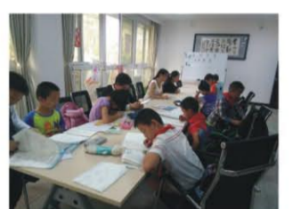
(图文：薄荷社会工作服务中心)

开课近一个月以来，薄荷社会工作服务中心共进行5次作业辅导，小组活动开展2次，课堂公约制作和儿童自我意识测量调查。本月29号，薄荷社会工作服务中心根据实际需要，将开展四点半课堂学生家长家长会。届时中心社工向全体家长介绍中心四点半课堂目前的情况以及即将开展的活动，并就如何正确引导孩子培养良好的学习、行为习惯以及如何注意安全等与家长进行互动交流。