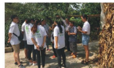
(图文：万州明爱社会工作服务中心洪安村社工站)

经过活动的开展，拉近了当地村民与社工之间的距离，使五保老人感受到了社工对于他们的关爱，也让更多的志愿者了解到目前五保老人的生活，更自愿的加入到承担社会责任的行业中来。