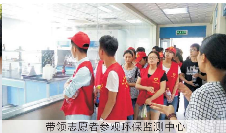
带领志愿者参观环保监测中心