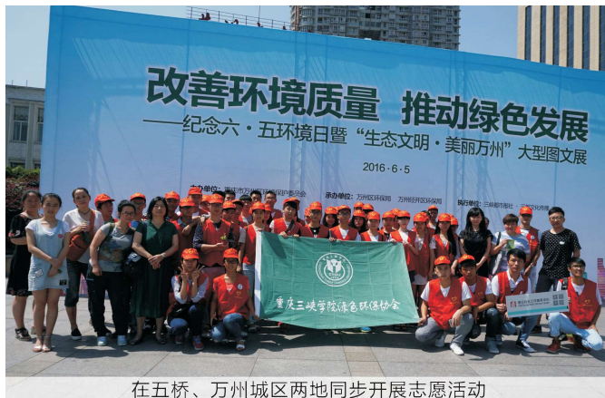
在五桥、万州城区两地同步开展志愿活动

我们相信在全区人民共同努力下，万州将成为一个山青，水绿，天蓝更适合人们居住的江畔之滨，莺鸟啼鸣，花香四溢。