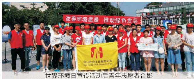
世界环境日宣传活动后青年志愿者合影

2016年6月5日，为了践行人与自然和谐共生和绿色发展的理念，区环保局联合团区委携手德立社会工作服务中心在万州和平广场和五桥学府广场两地同时举办“改善环境质量，推动绿色发展”的主题活动。希望借此活动提高市民的环保意识和改善环境的信心，参与到生态文明的建设中来，将万州打造成为山清水秀的桃源之地。