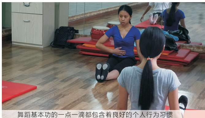
舞蹈基本功的一一点一滴都包含着良好的个人行为习

中国青少年研究中心的专家孙云晓指出：“习惯决定孩子的命运。”习惯的力量是巨大的，人一旦养成一个习惯，就会不自觉地在这个轨道上运行，如果是好习惯，将会终身受益，孩子少儿时期是培养习惯的最佳时期，有一个公式：早期教育花一公斤的气力=后期教育花一吨的气力。说明了早期教育的重要性。我中心以艺术、环保、阅读三个方面来促进青少年养成良好生活、学习行为习惯。并邀请第三方研究团队介入，主要从为什么要开展行为养成教育，针对我中心的在行为习惯养成教育方面的实践进行有效评估，论证项目对青少年成长的促进性。