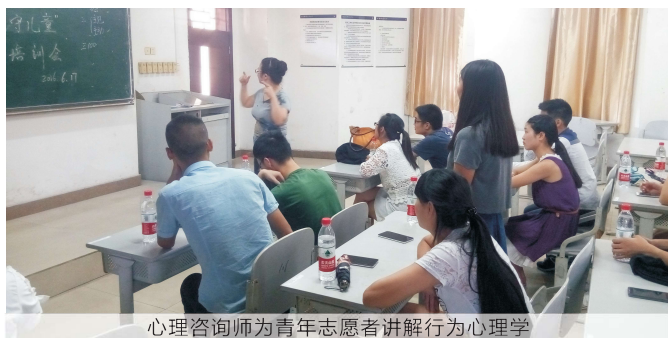
心理咨询师为青年志愿者讲解行为心理学

青年人 青年人朝气蓬勃，有如初升的太阳，是国家的未来、民族的希望。城市的进步离不开青年人。习近平总书记在多个场合多次提到“青年兴则国家兴，青年强则国家强。”万州有超过七所大学，总人数超过5万名在校大学生，组织、引导、服务青年大学生参与志愿服务，不仅能推动城市文明进步，还能使青年人得到锻炼和成长，学习人生经验和知识。我中心以公益项目为载体，定期组织青年志愿者培训，并输送至各公益项目中，让青年志愿者在实践中施展自己的才华，实现自己有意义的人生价值。引导青年人在参与社会服务过程中检视反思，成为有自主解决问题能力的人，见证自己的成长与蜕变。永远相信，美好的事情即将发生。