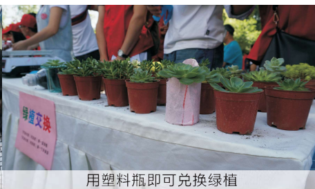
用塑料瓶即可兑换绿植