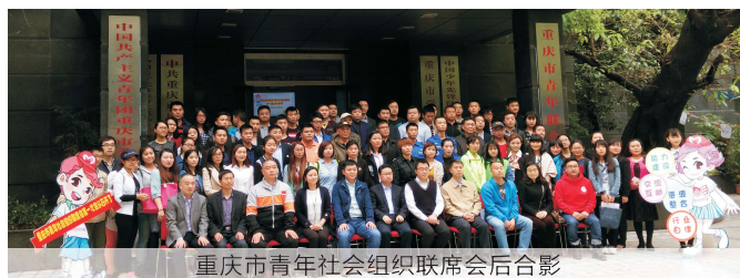
重庆市青年社会组织联席会后合影