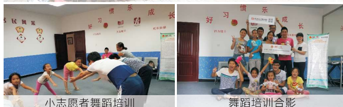
小志愿者舞蹈培训