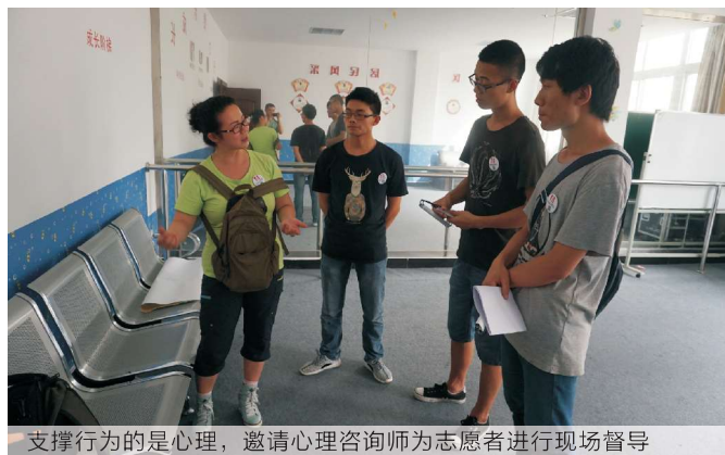
支撑行为的是心理, 邀请心理咨询师为志愿者进行现场督导

艺术培养 主要通过舞蹈、美术、艺术语言的方式对青少年在个人行为、审美观察给予培训，其目标是让于少年养成良好的行、立、座、卧的姿势和习惯，培养对事物细致的观察力，好的行为习惯贵在坚持，我们计划用一年的时间来引导、陪伴和见证变化。目前承接了团市委组织部群团服务站市级示范点服务项目（“好习惯、乐成长”青少年良好行为习惯养成服务项目），针对陈家坝移民社区内7-11岁流动青少年，透过舞蹈、美术、口才与演讲三个方面进行培育和引导，以促进良好行为习惯的养成，引入第三方针对项目本身和服务人群进行客观研究和评估，为下一步行动提供理论依据。