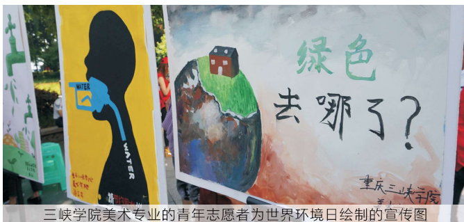
三峡学院美术专业的青年志愿者为世界环境日绘制的宣传图

环境友好 简单来说，就是把环境当成朋友，可以互动、保护和爱护环境，环境就会给你较好的生存条件。《关于加快推进生态文明建设的意见》渝委发〔2014〕19号文件，2016年政府工作报告，《中共中央关于制定十三个五年规划的建议》等相关文件均提出“绿色是永续发展的必要条件和人民对美好生活追求的重要体现。必须坚持节约资源和保护环境的基本国策，坚持可持续发展，坚定走生产发展、生活富裕、生态良好的文明发展道路，加快建设资源节约型、环境友好型社会，形成人与自然和谐发展现代化建设新格局，推进美丽中国建设，为全球生态安全作出新贡献。”我们相信社区居民每人一小点的环境友好行为，将会改变整个世界。