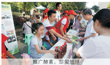
推广酵素, 珍爱地球